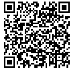
総務省 特設ページ