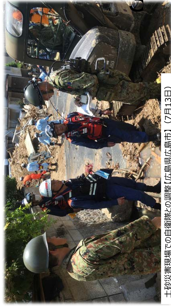
土砂災害現場での自衛隊との調整【広島県広島市】（7月13日）