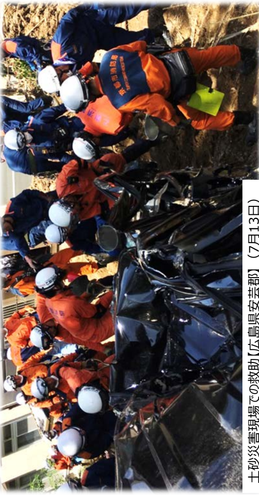
土砂災害現場での救助【広島県安芸郡】（7月13日）

23都府県から出動した緊急消防援助隊延べ約1,700隊7,000人、ヘリ105機 が、岡山県、広島県、愛媛県及び高知県にて活動し、合計366人を救助