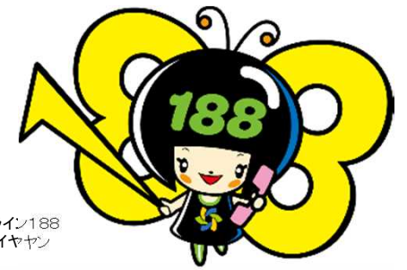
消費者ホットライン188 キャラクターイヤヤン