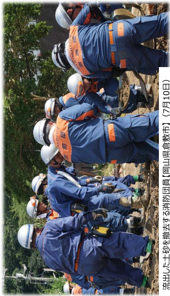
流出した土砂を撤去する消防団員【岡山県倉敷市】（7月10日）