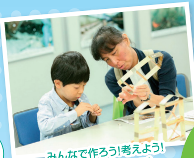
みんなで作ろう!考えよう! ワークショップ