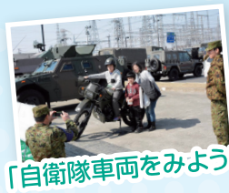
「自衛隊車両をみよう!」