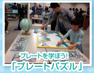
プレートを学ぼう! 「プレートパズル」