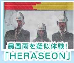
「暴風雨を疑似体験!」 「HERASEON」