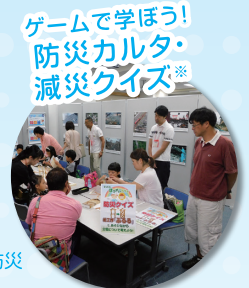
ゲームで学ぼう! 防災カルタ・ 減災クイズ※