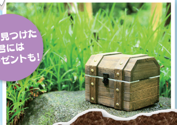
宝を見つけた 君には プレゼントも!