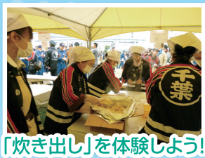
「炊き出し」を体験しよう!