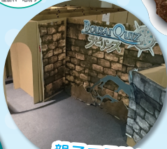
親子で冒険! 防災ラビリンス※