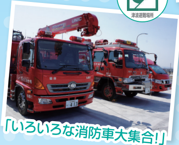
「いろいろな消防車大集合!」