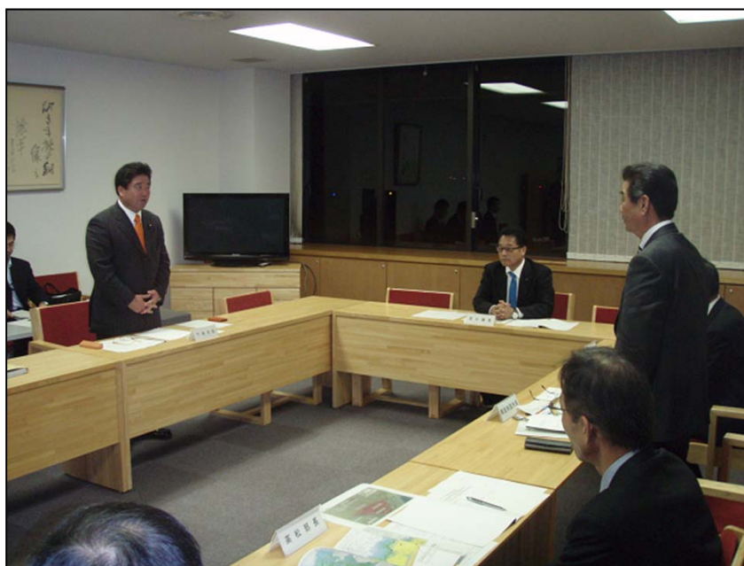
橋詰南国市長と意見交換を行う下地大臣 (於:南国市・高知龍馬空港)