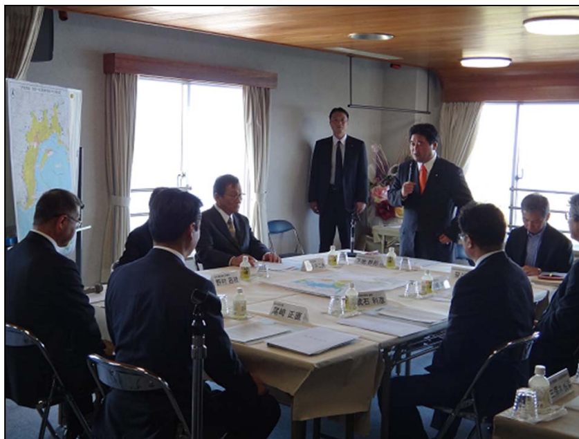
尾崎高知県知事、武石高知県議会議長、板原土佐市長、自主防災組織 担当者と意見交換を行う下地大臣 (於:土佐市・国民宿舎土佐)