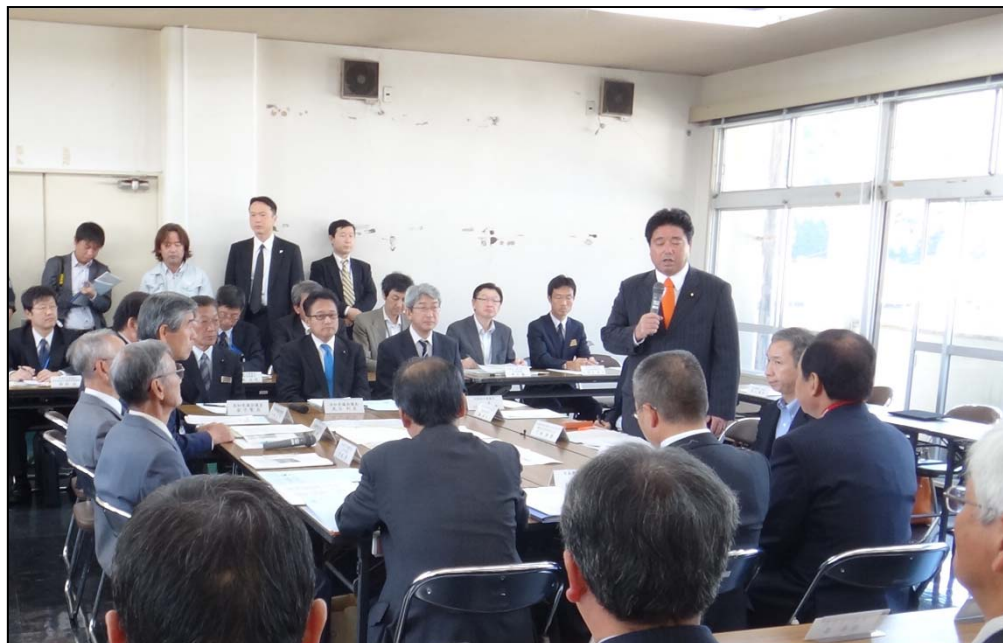
植田黒潮町副町長、地元郵便局長、自主防災組織担当者と意見交換を行う下地大臣 (於:黒潮町・佐賀庁舎)