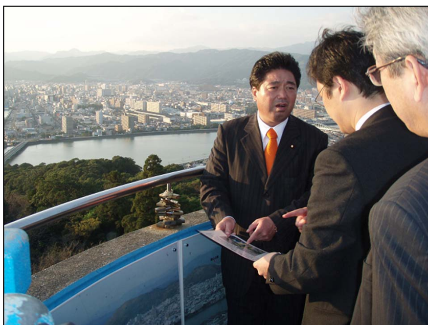
高知市内の浸水が想定される地域について説明を受ける下地大臣 (於:高知市・五台山)