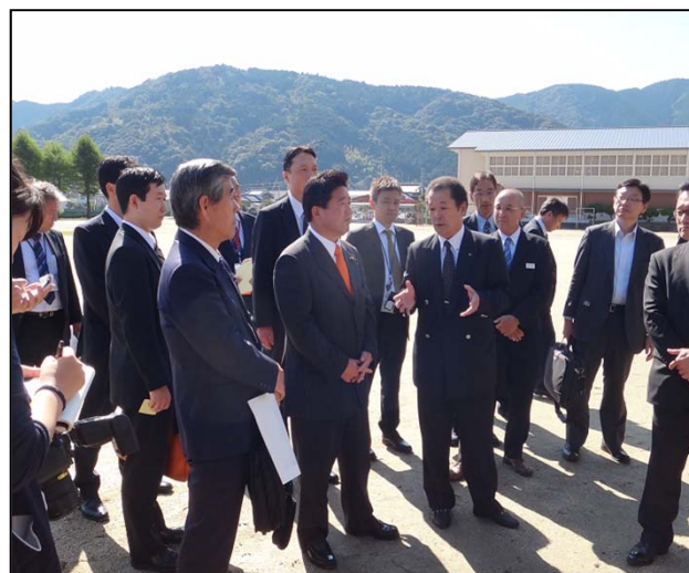
佐賀郵便局(左)及び佐賀中学校(右)を視察する下地大臣 (於:黒潮町)