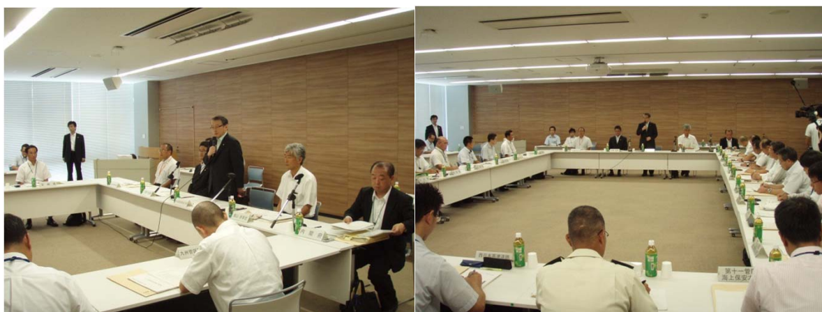
南海トラフ巨大地震対策九州ブロック協議会に出席し、挨拶をする中川大臣 (於:宮崎駅前ビルKITEN大会議室)