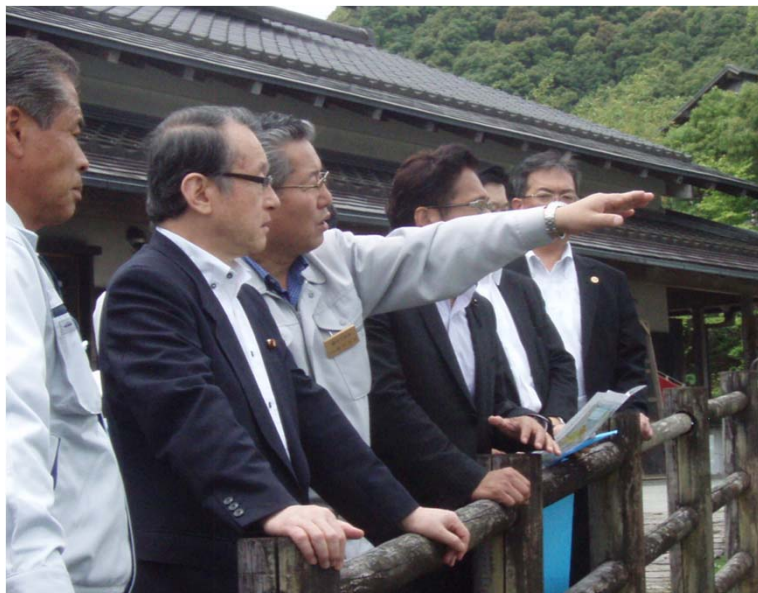
池田中土佐町長から説明を受ける中川大臣（於：黒潮本陣）