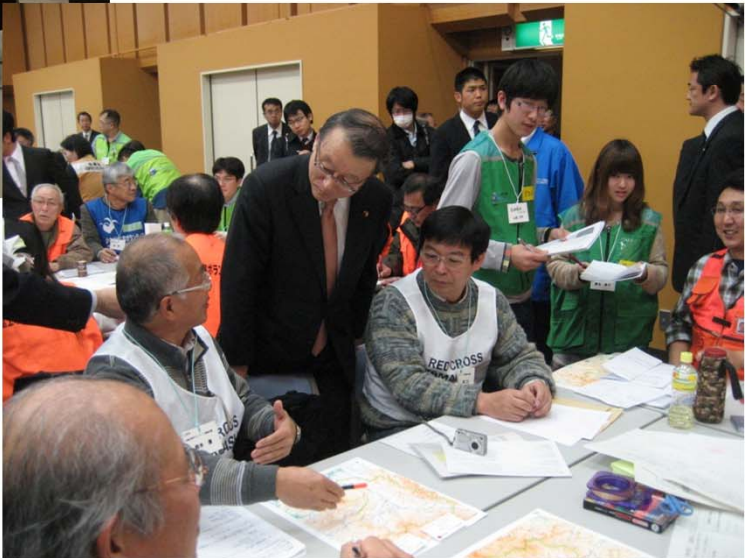
↑→ 災害ボランティア図上訓練参加者を 激励し、ワークショップでの熱心な 議論を視察する中川大臣(於:静岡 県総合社会福祉会館)