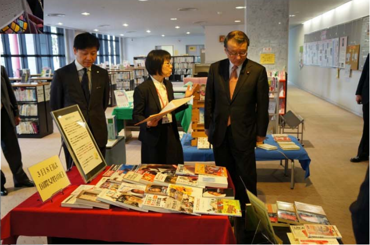
静岡市女性会館内の図書コーナーを見学し、担当者から説明を受ける中川大臣