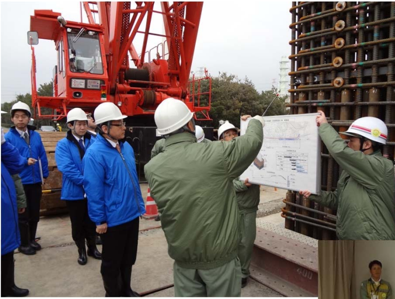
浜岡原子力発電所内の津波防潮壁建設現場において、中部電力から説明を受ける中川大臣 ←