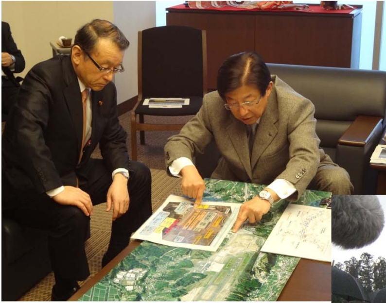
川勝静岡県知事から富士山静岡空港について説明を受ける中川大臣 (於:富士山静岡空港)