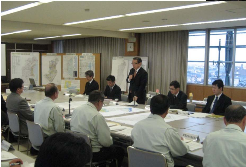
↑ 川勝静岡県知事、清水焼津市長と地震・津波対策について意見交換する中川大臣 (於:焼津市庁舎内会議室)