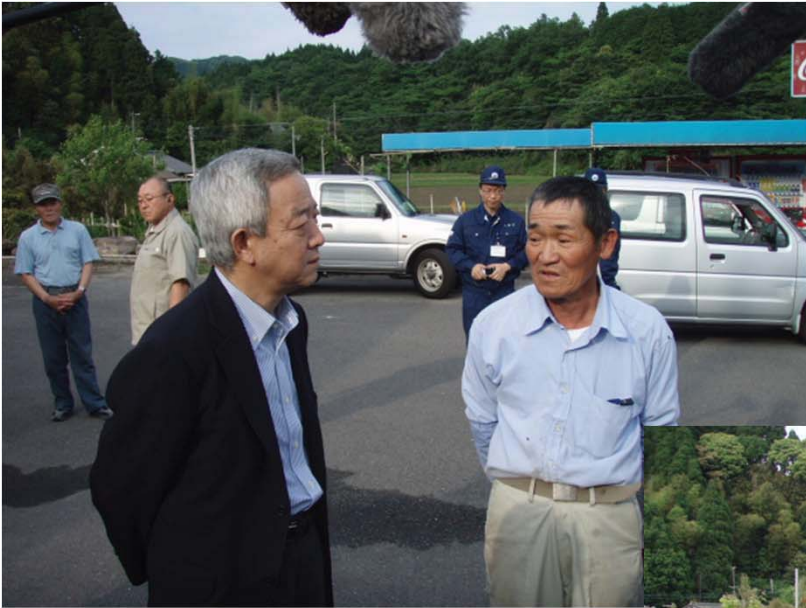
都城市夏尾町の住民の方々と 本年1月～3月頃の降灰被害状況 を振り返りながら、今後の土石流 対策等に注意をお願いする松本 大臣