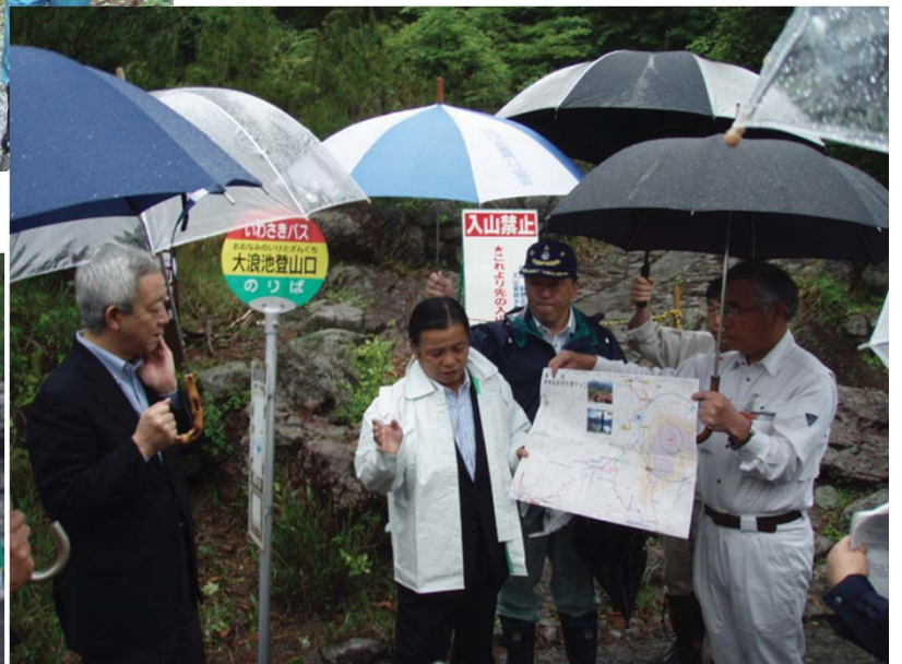
前田 霧島市長より登山道の安全確保状況等につ いて説明を受ける松本大臣