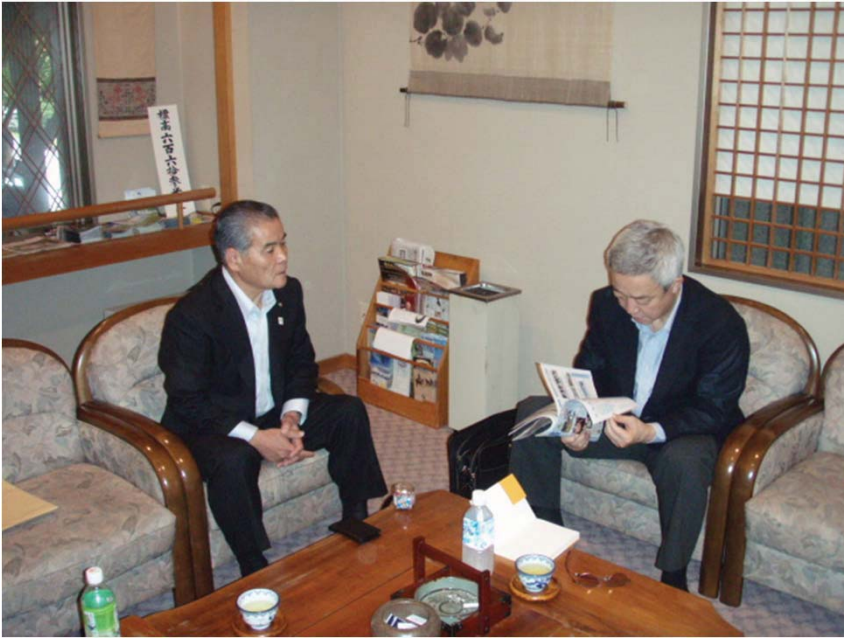
日高 高原町長と新燃岳の火山 防災対策等について意見交換す る松本大臣