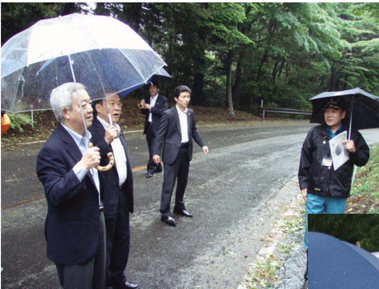
霧島市担当者から県道1号線噴石 飛来現場(2月1日)にて当時の災害 状況の説明を受ける松本大臣