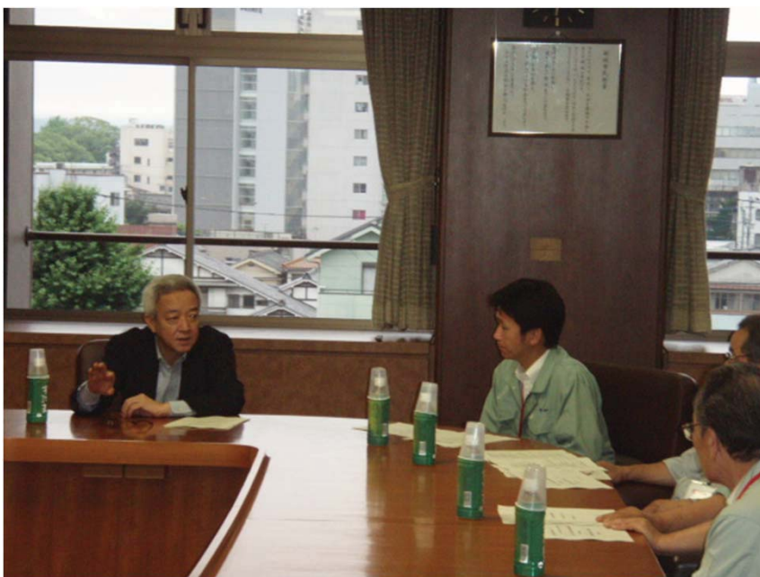
長峯 都城市長と新燃岳の火山 防災対策等について意見交換す る松本大臣