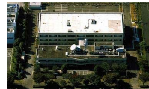
(立川広域防災基地)